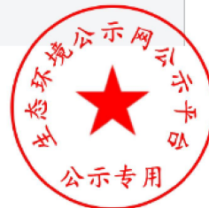
图 2-1 首次环境影响评价信息网络公开截图