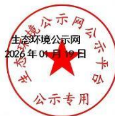
图 3-1 征求意见稿环境影响评价信息网络公开截图