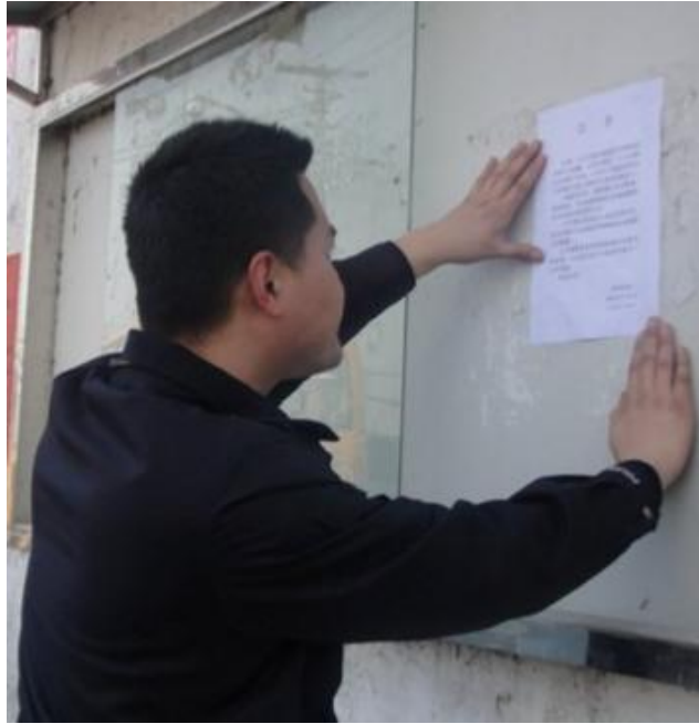
图 3-5 张贴公告照片