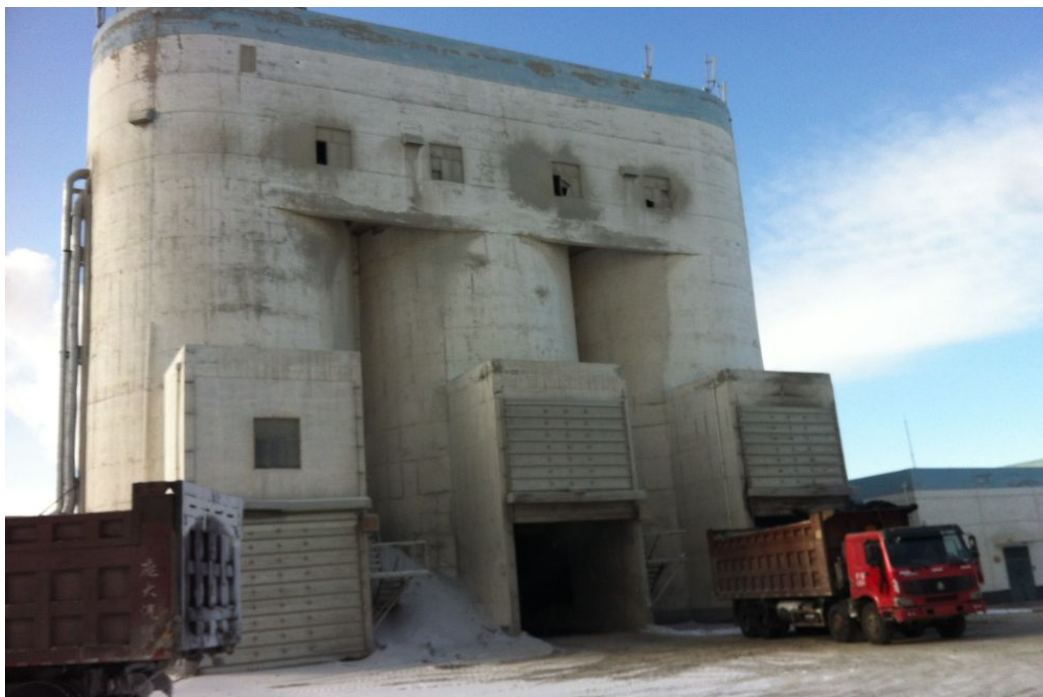
除尘灰运送至灰库