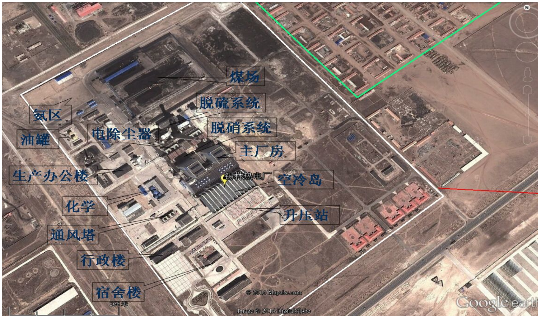
图1 厂区平面布置图