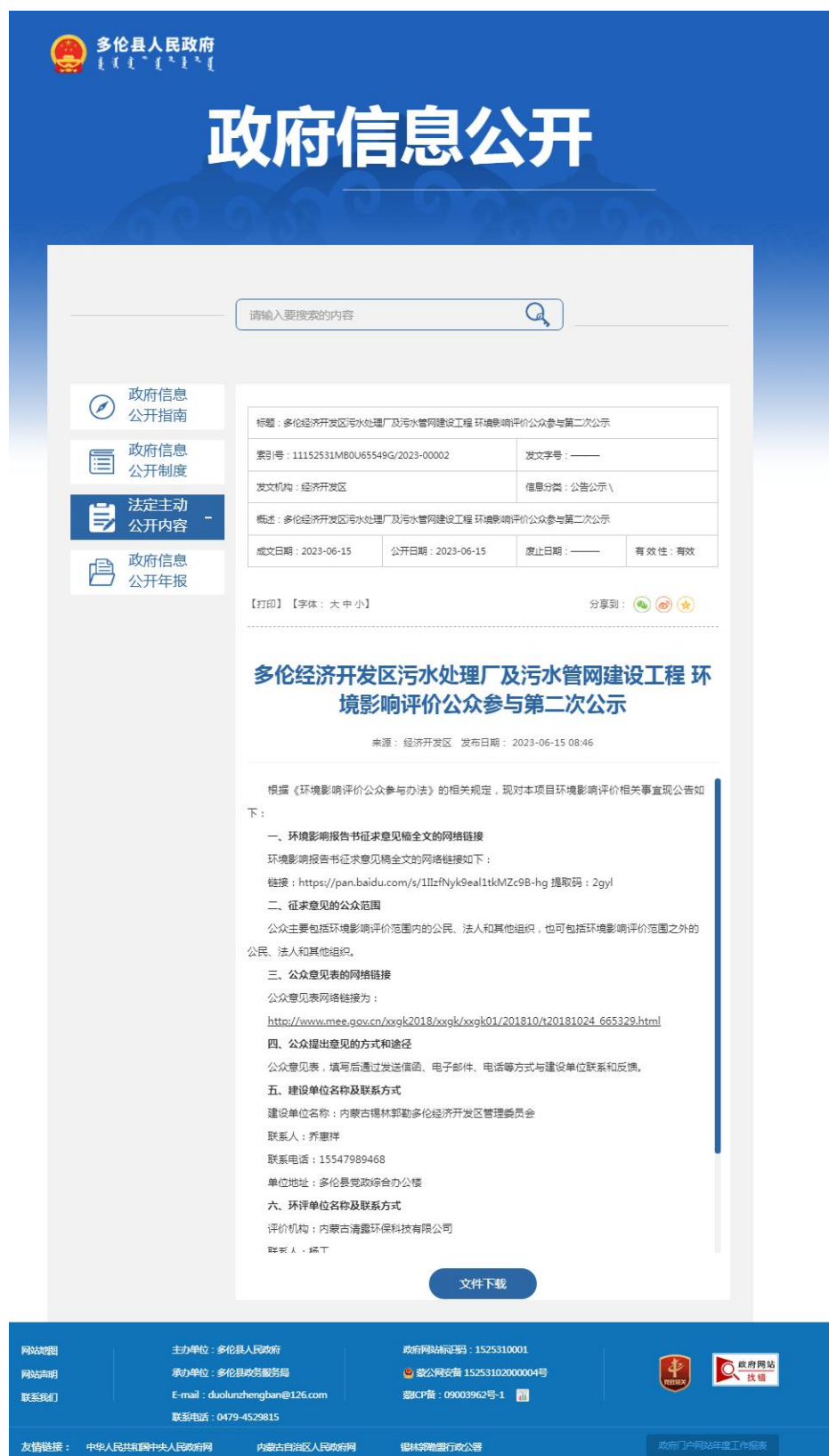
图 3.2-1 第二次公示网络截图 (1-1)