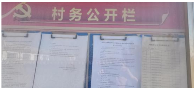
当地村庄进行公示