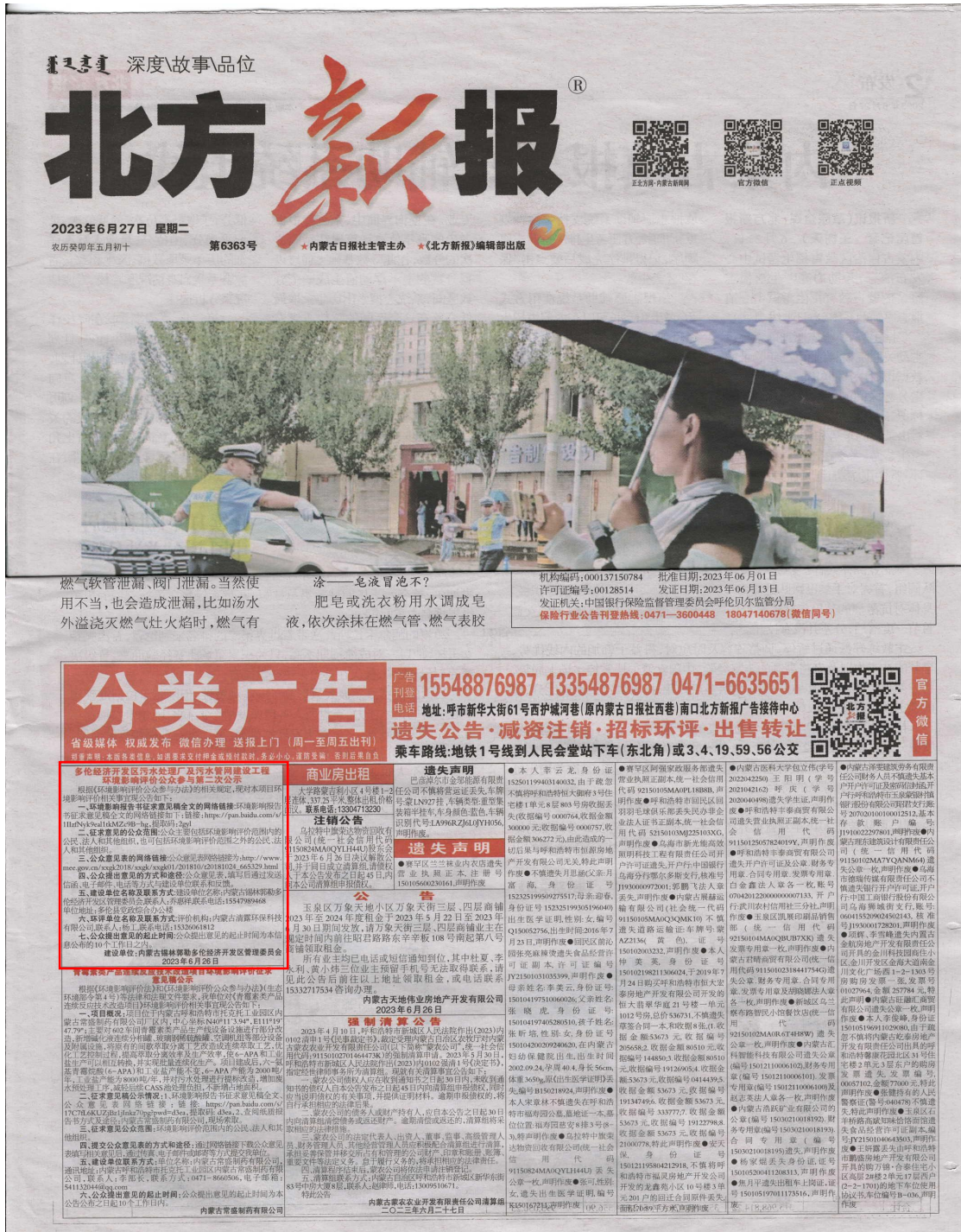
图 3.2-3 6.27 报纸公示截图