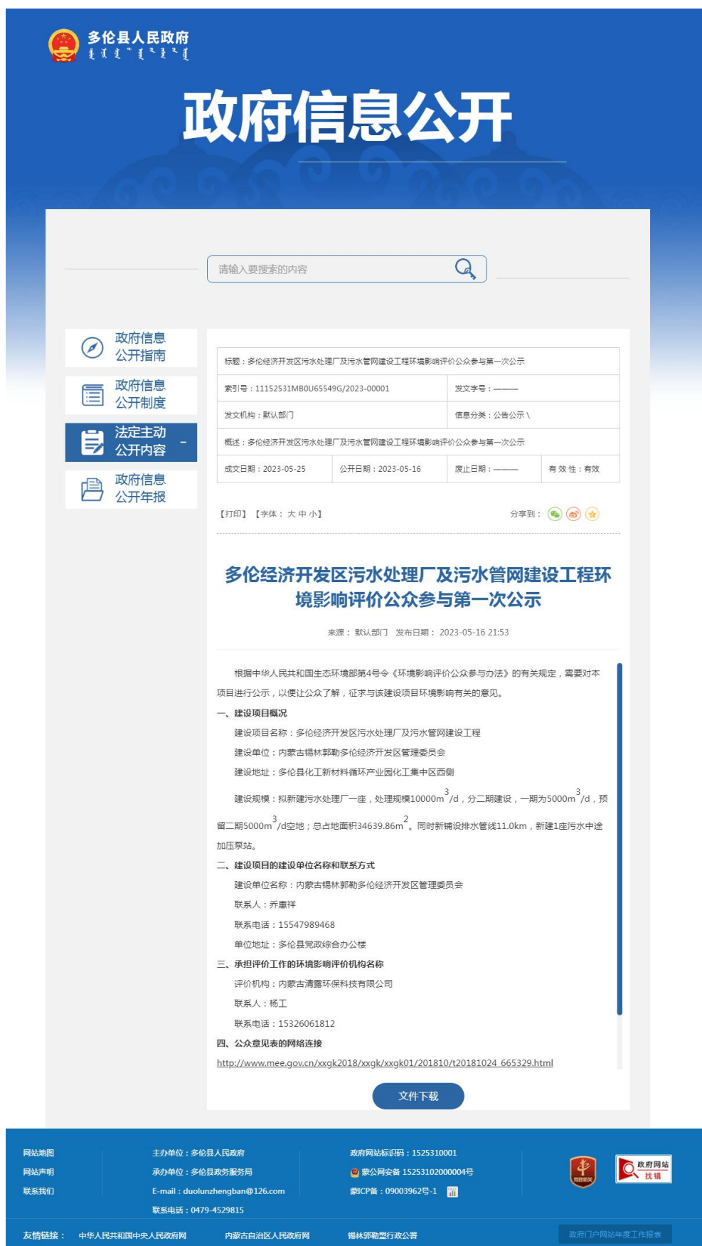
图 2.2-1 第一次公示网络截图