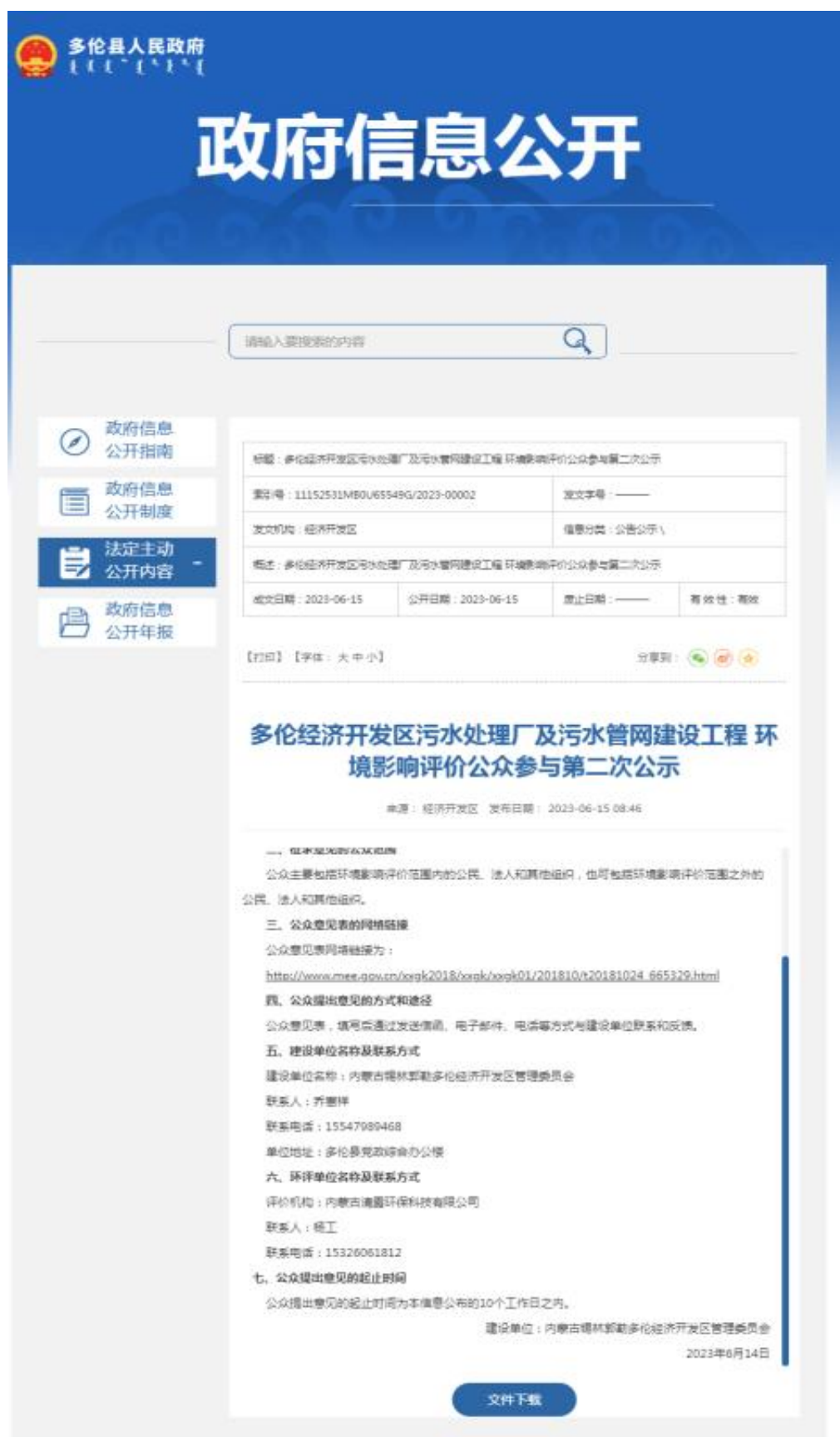
图 3.2-1 第二次公示网络截图 (1-2)