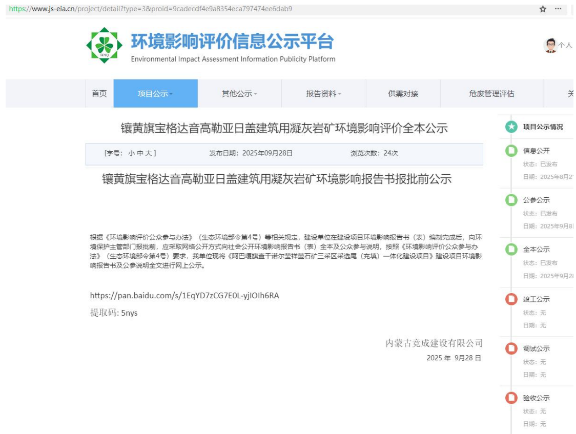
图 6.2-1 报批前公示截图