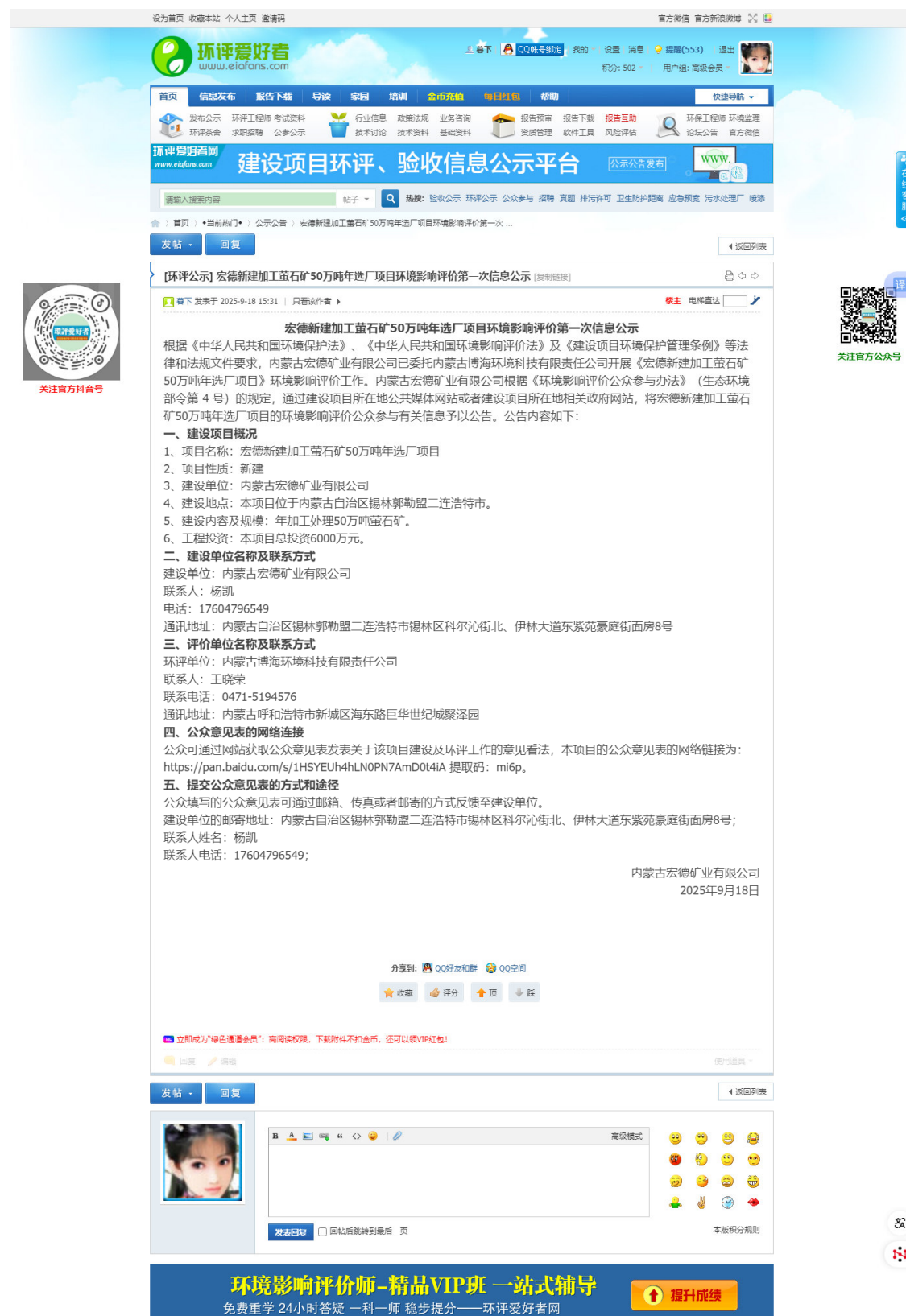
图 2.2-1 第一次环境影响评价信息公示网站截图