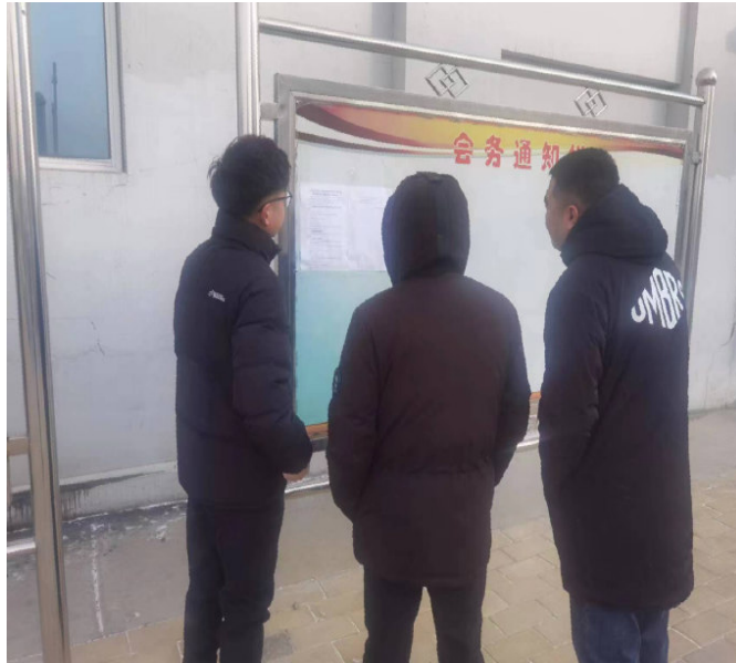
图 3.2-2 张贴公告照片