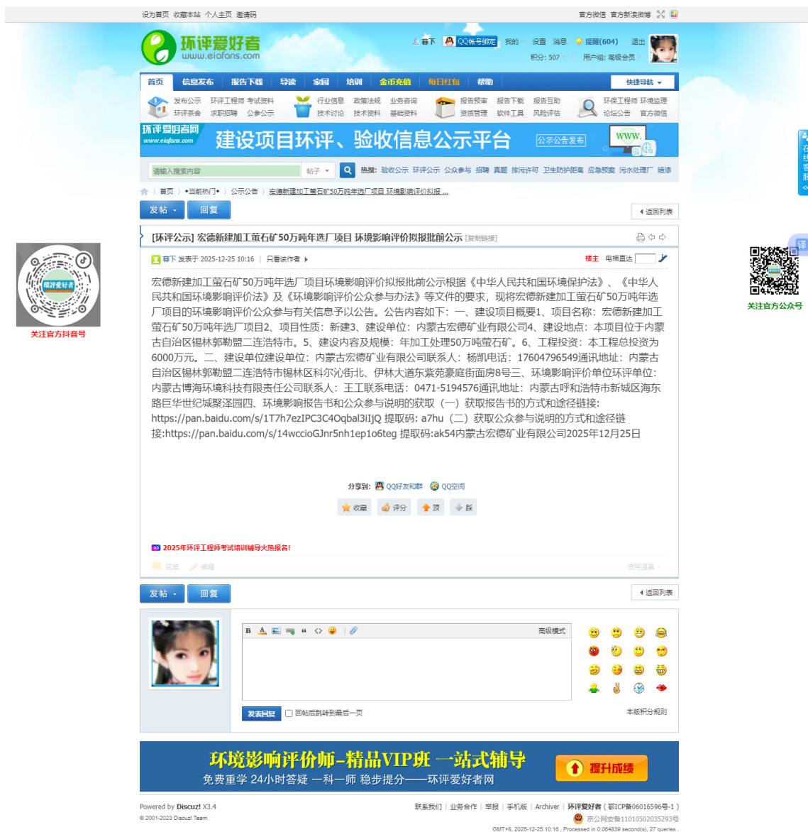
图 6.2-1 拟报批前公示网站截图

http://www.eiafans.com/thread-1440842-1-1.html