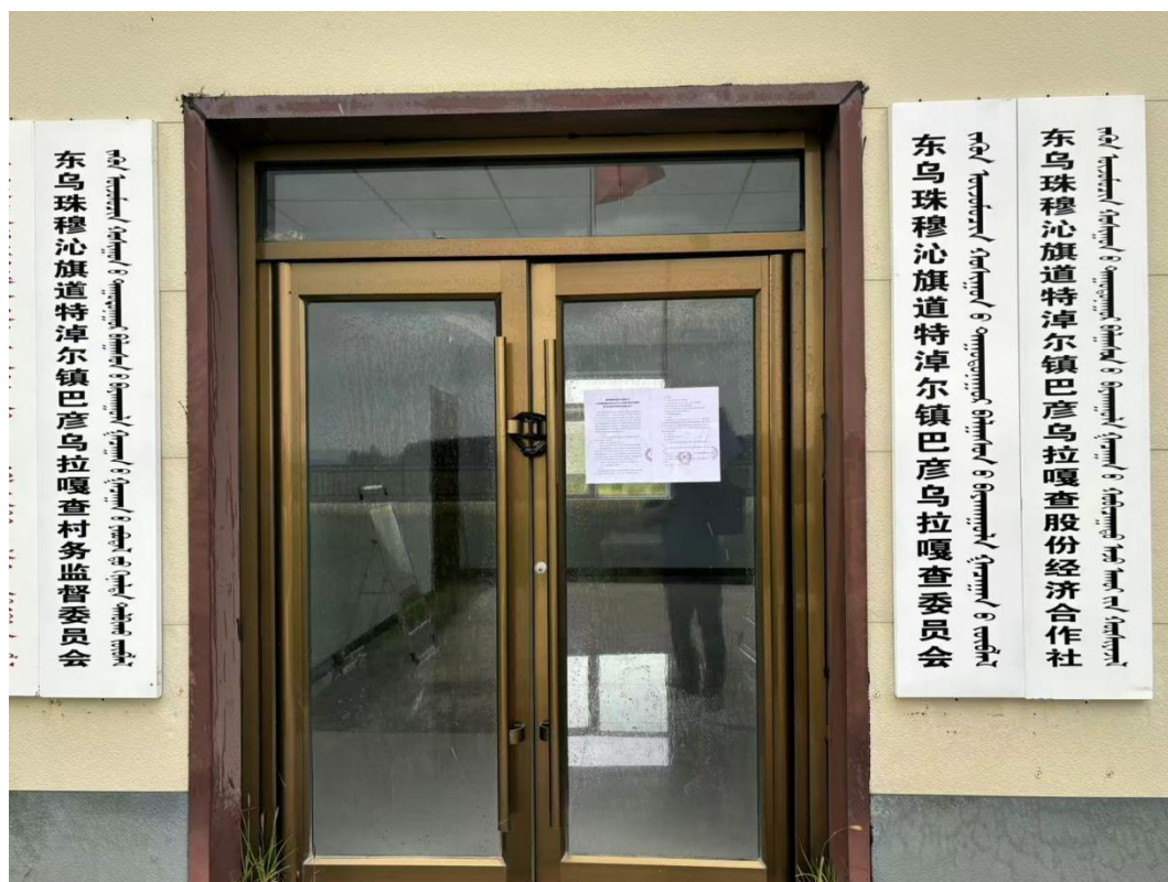
图 3-4 张贴公告