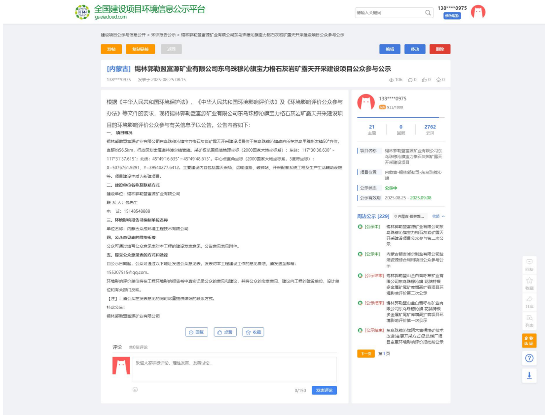
图 1 第一次公告情况