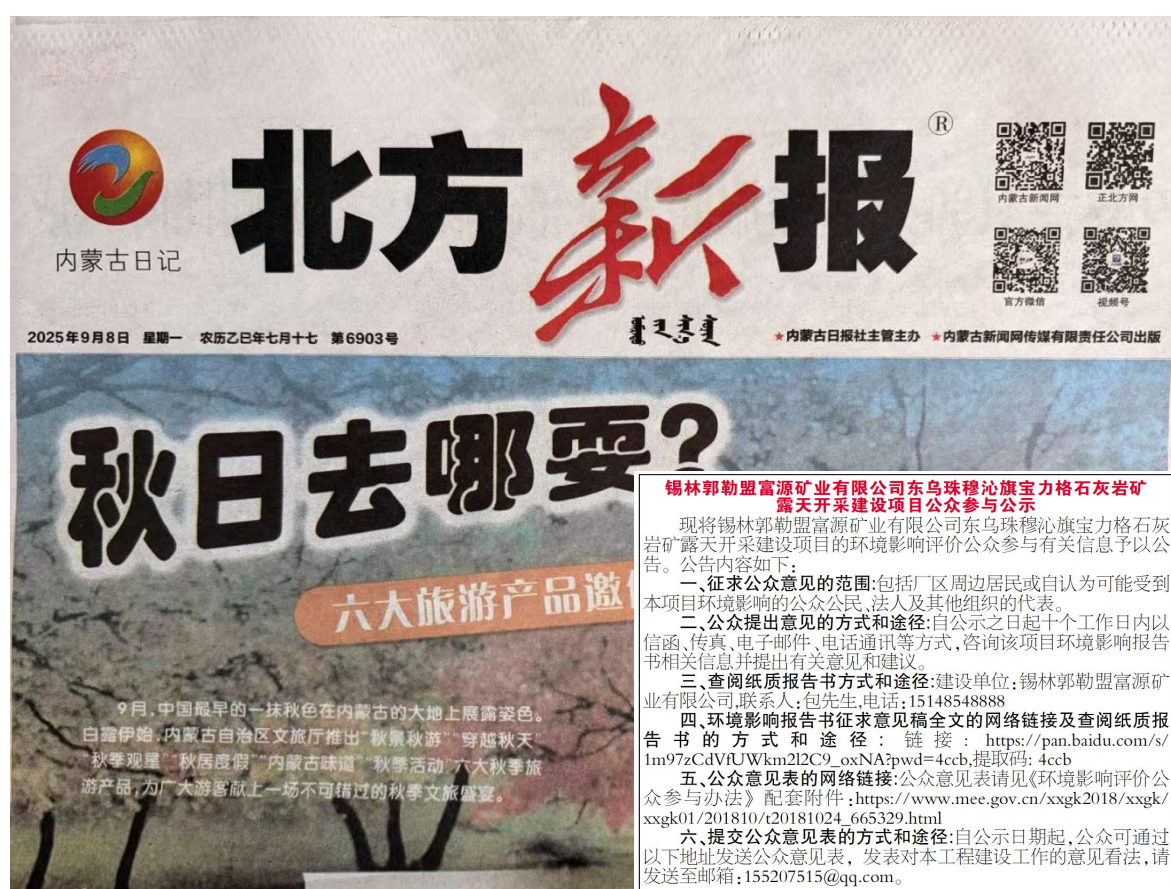
图 3-2 第一次报纸公示图