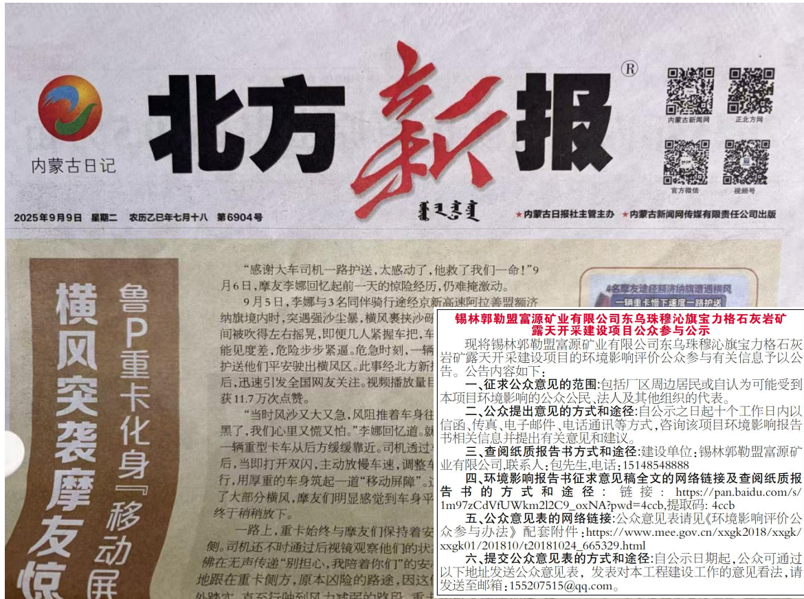
图 3-3 第二次报纸公示图